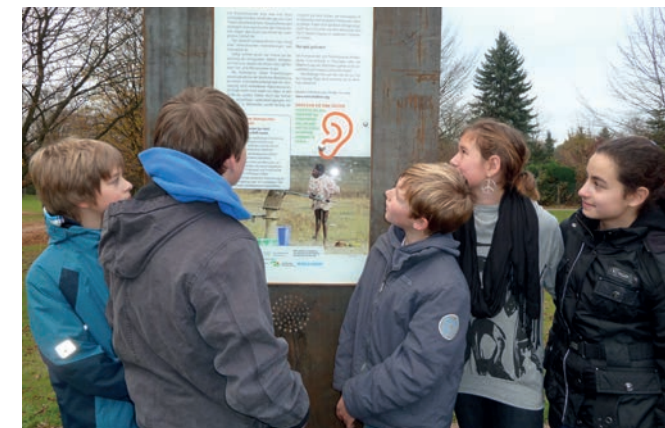
Schüler/innen der Gertrud-Bäumer-Realschule