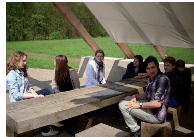
Schüler/innen der Rudolf-Steiner-Schule