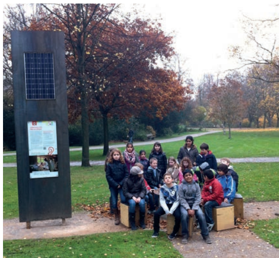
Schüler/innen des Rußheideschule

Die Rad-AG des 7. Jahrgangs radelt dort regelmäßig vorbei und achtet darauf, dass nichts verunreinigt und zerstört wird. Die entwicklungspolitischen Ziele des Millenniums-Radwegs sollen schwerpunktmäßig im Gesellschaftslehre Unterricht thematisiert werden.