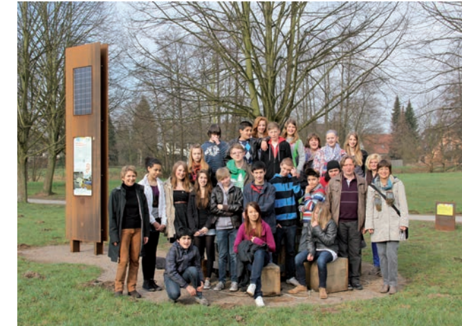
Schüler/innen des Martin-Niemöller-Gesamtschule

Wir sind die »Weltklasse« 7c der Martin-Niemöller-Gesamtschule. Schon seit dem 5. Schuljahr beschäftigen wir uns mit Themen, die sich auch in den Millenniumszielen wieder finden. Deswegen waren wir sofort dabei, als der Radweg geplant wurde. Für die Ziele der Station 8 »Aufbau einer weltweiten Partnerschaft für Entwicklung« haben wir schon ganz konkret etwas getan. Da wir seit nun 30 Jahren zwei Partnerschulen in Simbabwe haben, an denen in der Trockenzeit oft ohne Wasser für Kinder und Lehrer unterrichtet werden musste, hat unsere Schule 2011 einen Sponsorenlauf veranstaltet, bei dem 10.000 Euro »erlaufen« wurden. Mit diesem Geld konnten an beiden Partnerschulen Brunnen gebohrt und Pumpen installiert werden. Wir arbeiten seit fast drei Jahren immer wieder mit dem Welthaus zusammen, gerne haben wir daher die Betreuung der Radwegstation übernommen. Wir hoffen, dass viele Menschen die Millenniumsziele kennen lernen und zum Nachdenken über die schlimmen Probleme auf der Erde gebracht werden.