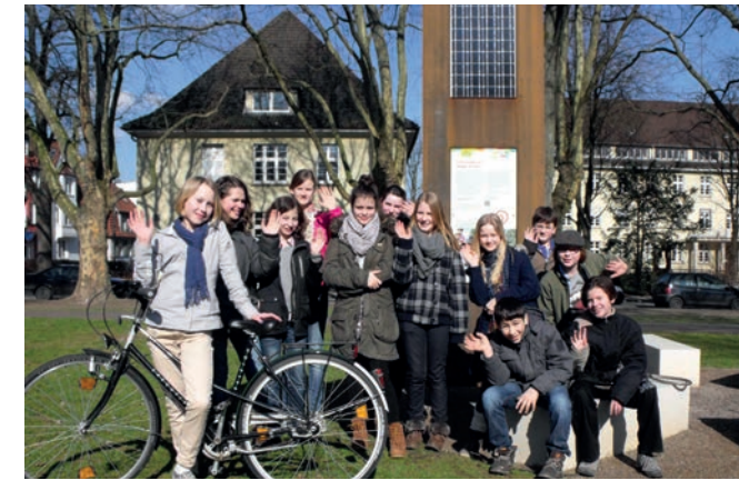
Schüler/innen des Ceciliengymnasiums

Bielefeld hat den Millenniums-Radweg und wir sind dabei! Die Gesamtschule Stieghorst hat die Patenschaft für die Station an den Kleingärten »Am Meierhof« übernommen. Die Ziele 4 und 5: »Senkung der Kindersterblichkeit« und »Gesundheitsversorgung der Mütter« werden hier dargestellt.