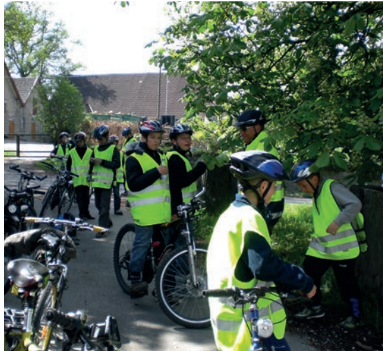
Schüler/innen des Gesamtschule Stieghorst