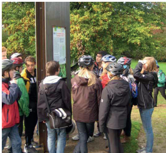
Schüler/innen des Max-Planck-Gymnasium